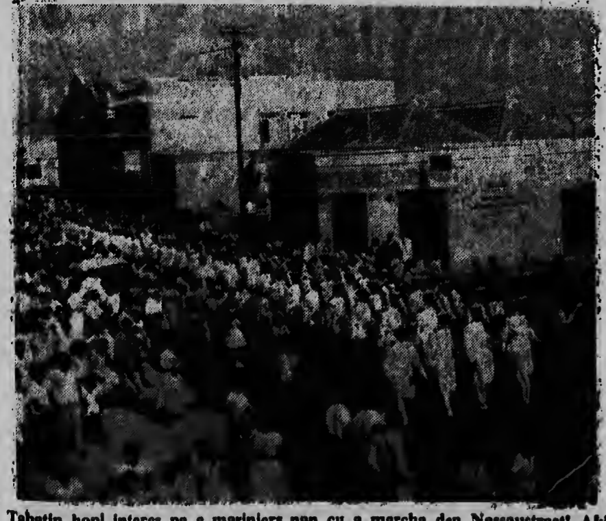
Tabatin hopi interes pa e mariniers nan cu a marcha den Nassaustraat. Aki nos ta weta un detachement den Nassaustraat banda di Hendrikstraat.